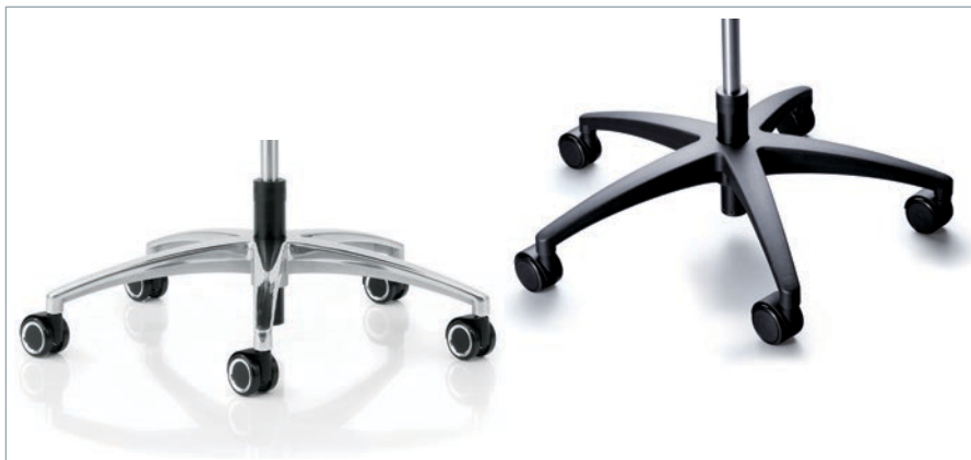
Fußkreuze wahlweise in Alu poliert oder glasfaserverstärktem Polyamid. Universalrollen mit Chromapplikation oder Standardrollen hart oder weich mit Abdeckung. Voetenkruis is verkrijgbaar in aluminium gepolijst of in glasvezel versterkt polyamide. Standaard uitgevoerd met harde of zachte wielen, of universele wielen met chroom accent.