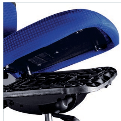
Werkzeugfreier Wechsel durch Polster-Clip-System. Zonder gereedschappen te verwisselen, door het Polster-Clip-Systeem.