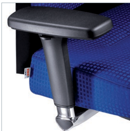
MF-Armlehnen AL 30 mit Deluxe-Pad, schwenkbar, höhen-, tiefen- und breiteneinstellbar, Halterung verchromt. MF-Armleuningen AL 30 met luxe pad, zwenkbaar, hoogte-, diepte- en breedte instelbaar, houder ver- chroomd.