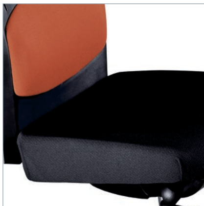
Standardsitz ohne TFK. Standaardzitting zonder TFK.