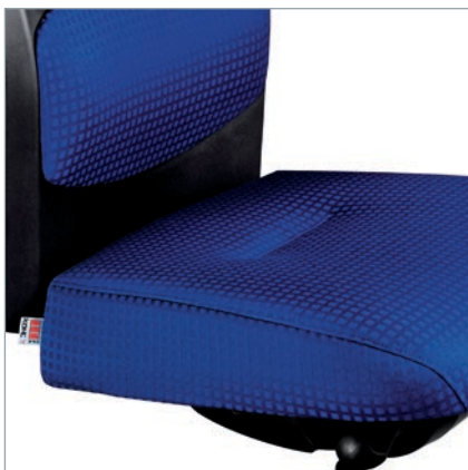
Taschenfederkern-Clipsitz (TFK) mit Seitenprofil. Pocketvering-clip-kussen (TFK) met zijprofiel.