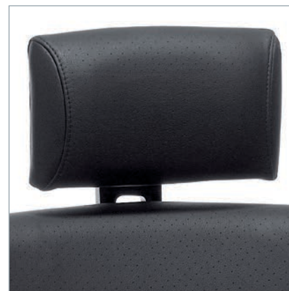
Kopfstütze Leder. Hoofdsteun met leer bekleed