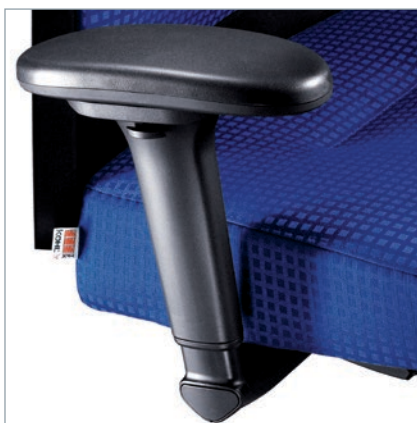
3D-Armlehnen AL 10 mit Soft-Touch-Pad, höhen-, tiefen- und breiteneinstellbar, Halterung PA Schwarz. 3D-Armleuningen AL 10 met Soft Touch Pad, hoogte-, diepte- en breedte instelbaar, houder PA zwart.