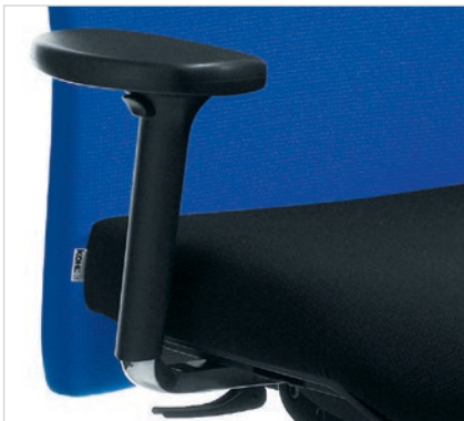
4D-Armlehnen Nr. 18 Komfortable PU-Auflage, Halterung Aluminium poliert, 10 cm höhenstellbar, 5,5 cm tiefeneinstellbares Pad schwenkbar je Seite 30°. Zusätzlich 8 cm breiteneinstellbar mit Schnellverschluss.