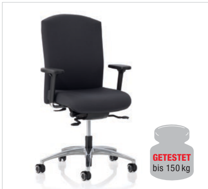
SELLEO® Version bis 150 kg lieferbar. SELLEO® versie tot 150 kg leverbaar.