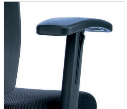
T-Armlehnen Nr. 07 Komfortable PU-Auflage, Halterung PA-Schwarz, 10 cm höhenstellbar, 8 cm breiteneinstellbar mit Schnellverschluss.