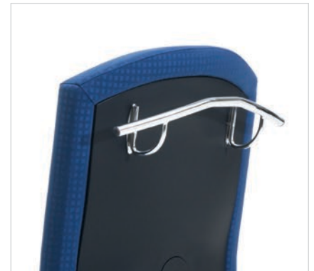
Rückenlehne mit Kleiderbügel. Verchroomde kledingbeugel.