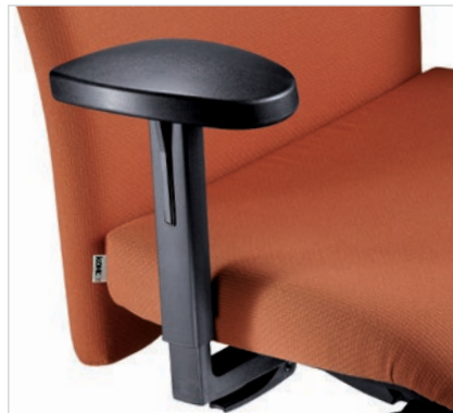
T-Armlehnen Nr. 17 Komfortable PU-Auflage, Halterung PA-Schwarz, 10 cm höhenstellbar. Zusätzlich 8 cm breiteneinstellbar mit Schnellverschluss.