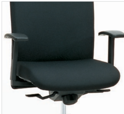
SELLEO® Permanentkontakt-Mechanik. SELLEO® Permanent-Contact-Mechanik.