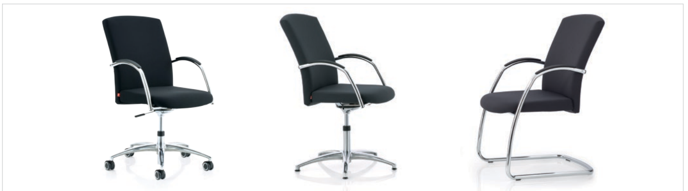
Drei Gestellvarianten optional mit: Fünfstrahligem Fußkreuz auf Rollen, Vierstrahligem Fußkreuz auf Gleitern oder Schwinger.